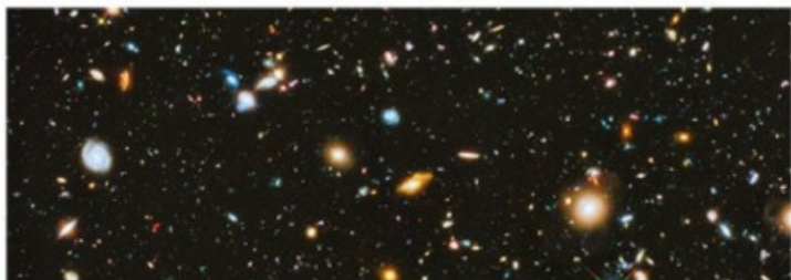
Galaxies photographiées par le télescope spatial Hubble.