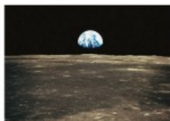
La Terre photographiée depuis la Lune au cours de la mission Apollo 8 (1968).